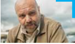
Ahmet Mümtaz Taylan

Hacettepe Üniversitesi Ankara Devlet Konservatuvarı Tiyatro Bölümü'nden mezun oldu. 1989-1993 yılları arasında Diyarbakır Devlet Tiyatrosu'nda çalıştı. Devlet Tiyatrolarında çeşitli zamanlarda, sanat yönetmenliği, genel müdür danışmanlığı gibi görevler üstlendi. 1996 yılından itibaren televizyon ve sinema yapımlarında çeşitli roller oynamıştır. Devlet Tiyatroları Sanatçıları Derneği (DETİS)'in kurucu üyesidir. Misafir oyununu sahneleyişiyle 2002 İsmet Küntay En İyi Yönetmen Ödülü kazanmıştır. 2004 yılında İnşaat filmiyle SİYAD Ödülleri En İyi Yardımcı Erkek Oyuncu Ödülü; 2008 yılında Made In Europe filmiyle Altın Koza Film Festivali En İyi Erkek Oyuncu Ödülü almıştır.